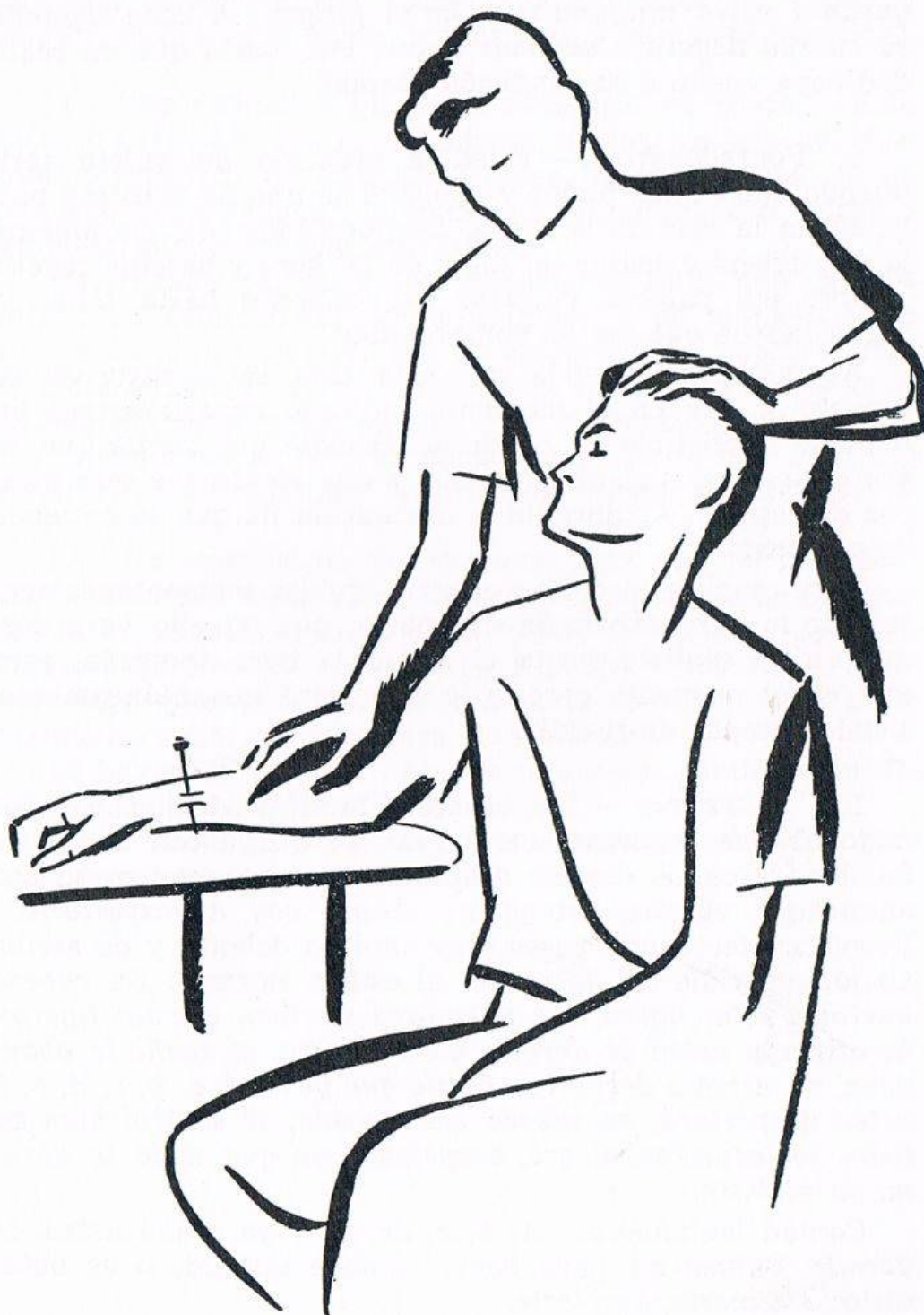
Fig. 15. EL SUJETO EN ESTADO DE HIPNOSIS TOTAL. Otro aspecto de la comprobación de la anestesia.