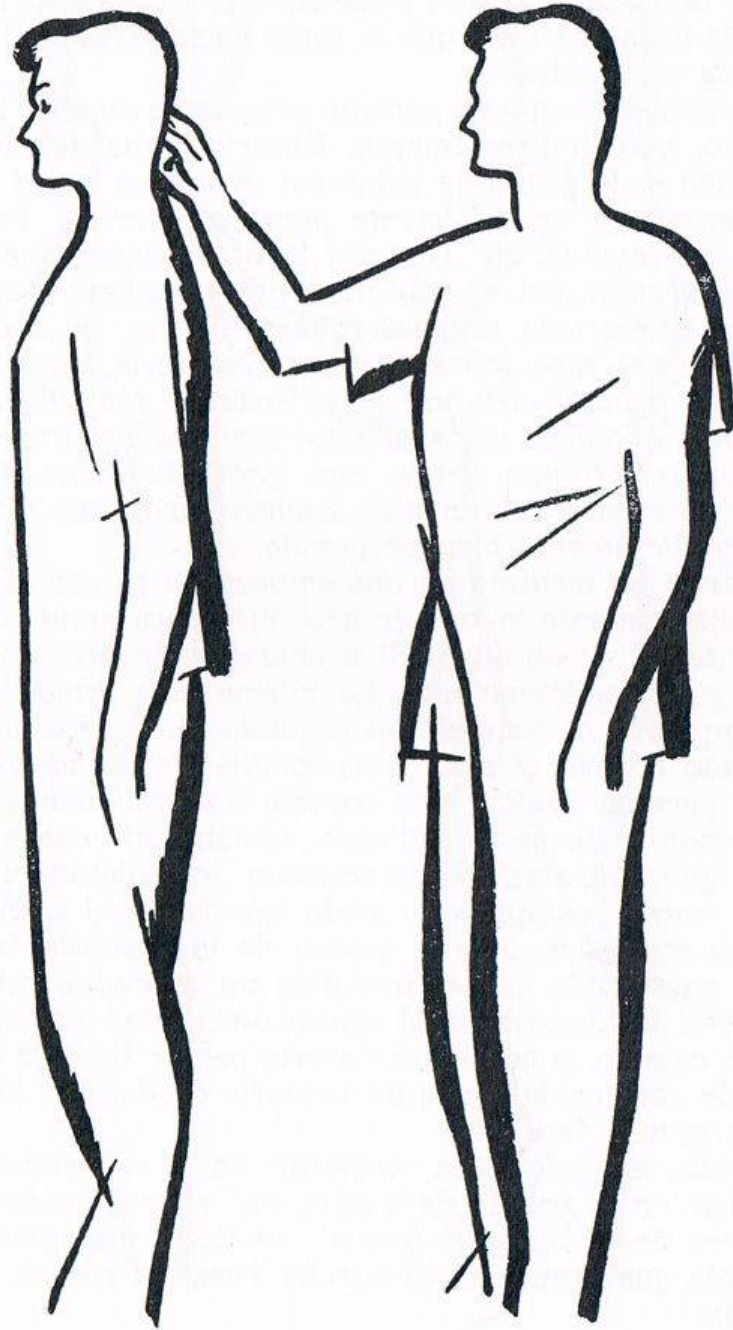
Fig. 2. CAÍDA HACIA ATRÁS, tercer tiempo . El operador pasa por detrás del sujeto, rozando con el índice el lado derecho de la cabeza de éste, y magnetizándole como se indica en el texto.