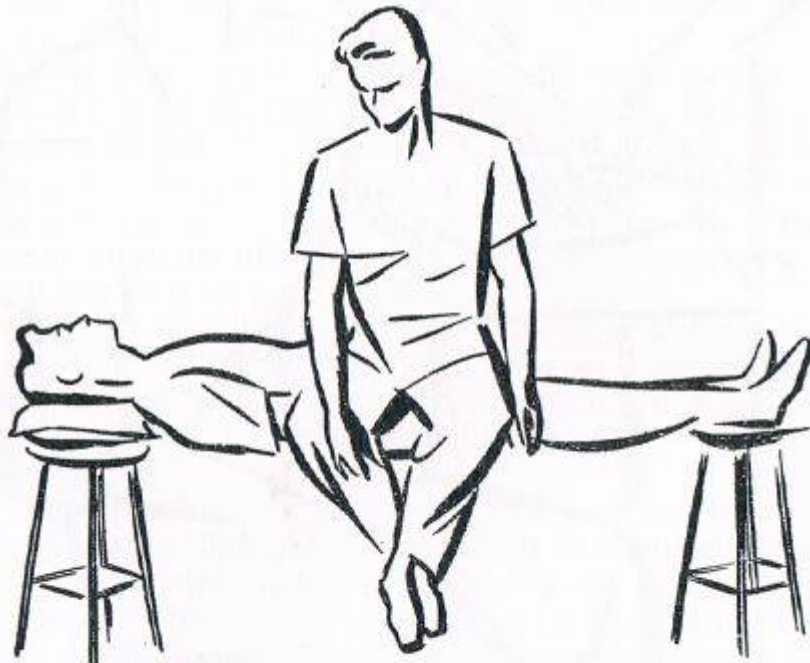
Fig. 14. SEGUNDO GRADO DE LA POSTHIPNOSIS. Prueba de la contractura general, con el soporte de peso hasta de cien kilos. Véase la página 140.

Cuando deseéis producir por primera vez la contractura general sobre un sujeto, hacer que descansa, no su nuca, sino el borde de sus hombros, sobre un mueble con respaldo cubierto de tela espesa; de igual modo, en lugar de colocarle sobre el borde extremo de los talones, procurad que se apoye sobre la media pierna. Hecho esto, se intenta suave, progresivamente, que soporte el peso de vuestro propio cuerpo, teniendo cuidado, para no lastimar al sujeto, de poner un cojín en el sitio de su tronco donde penséis quedar suspendido.