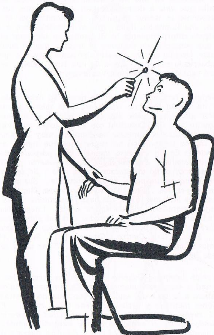
Fig. 7. PRODUCCIÓN DE LA HIPNOSIS TOTAL, otra forma . El operador la ejerce, en vez de hacerlo con los ojos, utilizando un objeto brillante.