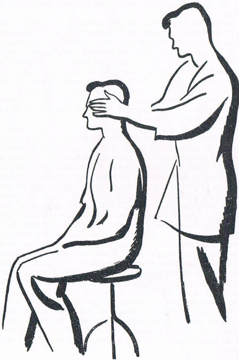
Fig. 9. PRODUCCIÓN DE LA HIPNOSIS TOTAL. Presión suave de los globos oculares.