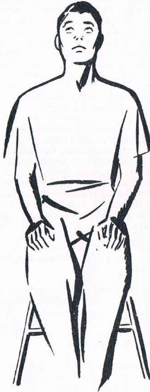
Fig. 8. PRODUCCIÓN DE LA HIPNOSIS TOTAL. Las dos acciones anteriores han determinado ya la oclusión o revulsión de los globos oculares.