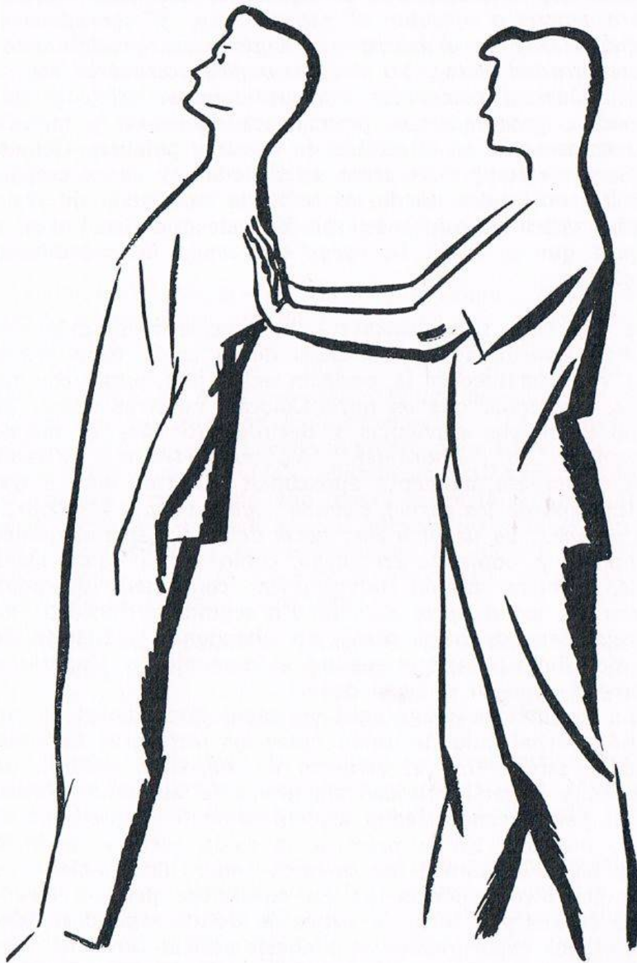
Fig. 4. CAÍDA HACIA ATRÁS, fin del cuarto y último tiempo . El cuerpo del sujeto cae aplomadamente hacia atrás, sosteniéndose tan sólo en las manos del operador.