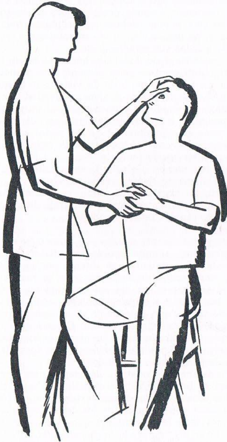
Fig. 5. CONTRACTURA DE LOS BRAZOS Y DE LAS MANOS. La posición que aquí se indica asegura el máximo de influencia.