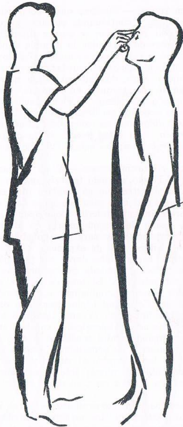
Fig. 1. CAÍDA HACIA ATRÁS, segundo tiempo . El primero nos parece suficientemente explícito en el texto. En cuanto al segundo, aquí representado, comienza en el momento en que el operador impulsa hacia atrás con el índice la cabeza del sujeto.