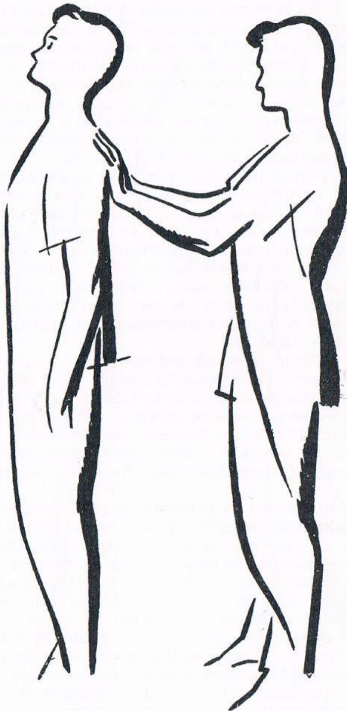
Fig. 3. CAÍDA HACIA ATRÁS, tercer tiempo y principio del cuarto . Este último comienza en el momento en que el operador aplica sus manos de plano sobre la región aquí indicada.