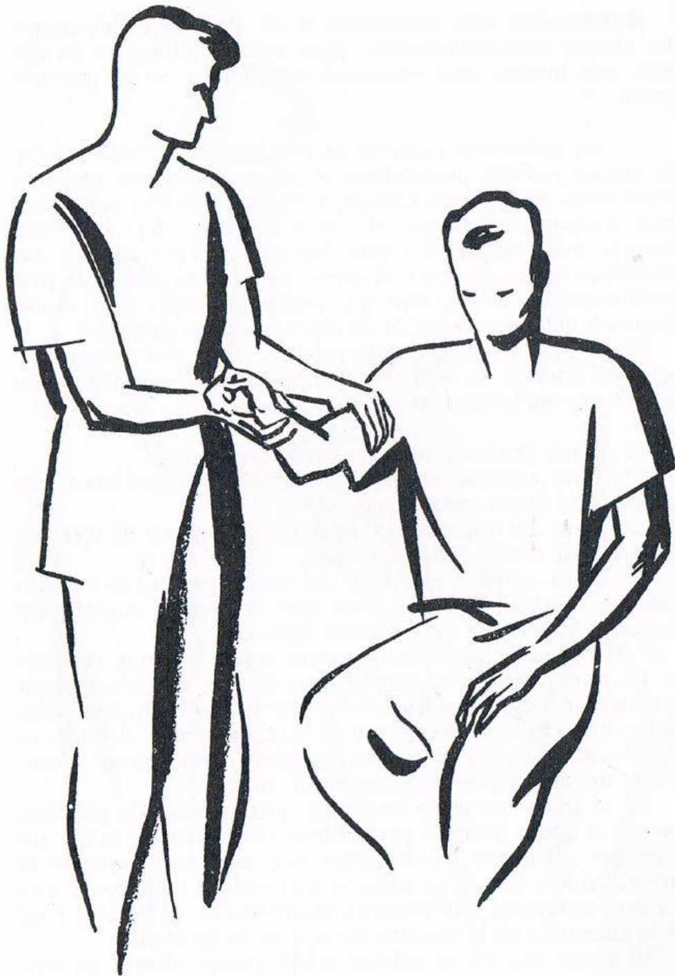
Fig. 11. COMPROBACIÓN DE LA HIPNOSIS. Lógrase, entre otros medios, por la contractura del brazo, como se indica en la página 134.