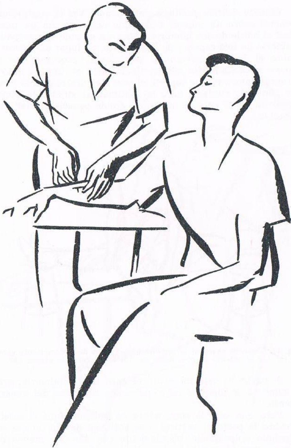
Fig. 13. COMPROBACIÓN DE LA ANESTESIA. Manera de introducir la aguja, a que se hace referencia en la página 134.